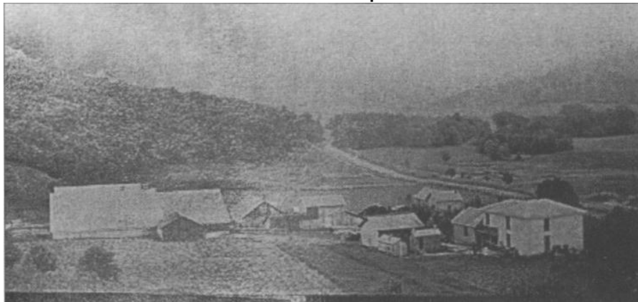
Die Farm der Pammels ca. 1885.

landwirtschaftliche Maschinen. Später nahm er an einem staatlichen Programm