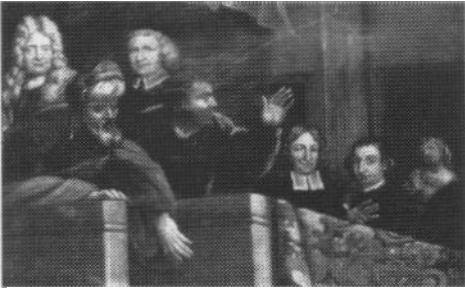
Ausschnitt aus dem Pfingstbild Corvey, Pfarrkirche

kein Zufall, daß die Position beider Herren sehr an eine Loge im Theater erinnert. Die Anwesenheit historischer Personen auf einem Andachtsbild wirkt auf uns befremdlich, entspricht aber wohl dem ausgeprägten Selbstgefühl barocker Herren. Bezeichnend ist der Unterschied zu gotischen