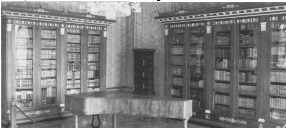
Fürstliche Bibliothek Corvey - Saal 2

Insgesamt waren also zehn Transporte notwendig um die aus ca. 36.000 Bänden bestehende Rotenburger Hofbibliothek nach Corvey zu schaffen. Nach dem ersten